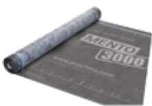
SOLITEX MENTO Aluskatteet