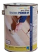
TESCON PRIMER RP Pohjustusaine