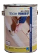
TESCON PRIMER RP Pohjustusaine