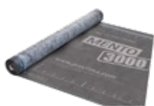
SOLITEX MENTO Aluskatteet