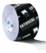
EXTONSEAL ENCORS Venyvä liitosnauha