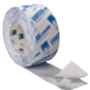
CONTEGA SOLIDO SL Liitosnauha sisäpuolelle