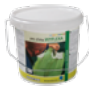
WYFLEXA Siveltävä tiivistysmassa