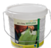
WYFLEXA Siveltävä tiivistysmassa