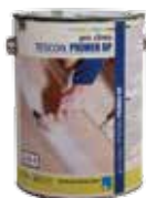
TESCON PRIMER RP Pohjustusaine