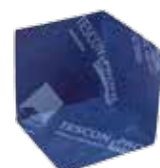
TESCON INCAV Nurkkaliitoskappale