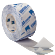
CONTEGA SOLIDO SL Liitosnauha sisäpuolelle