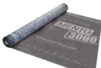
SOLITEX MENTO Diffuusioavoimet ulkokankaat