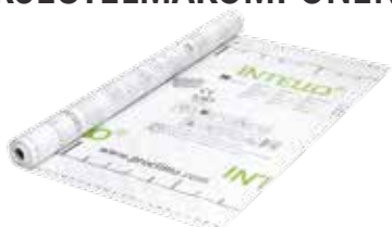
INTELLO ja INTELLO PLUS Kosteutta ohjaavat höyrynsulkukankaat