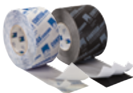
CONTEGA SOLIDO SL ja SOLIDO EXO Liitosnauhat sisä- ja ulkopuolelle