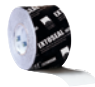
EXTOSAL ENCORS Butyylinauha