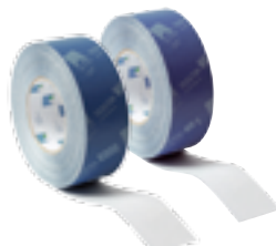
TESCON VANA ja TESCON No.1 Tiivistysteipit